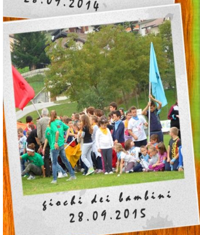
giochi dei bambini 28.09.2015