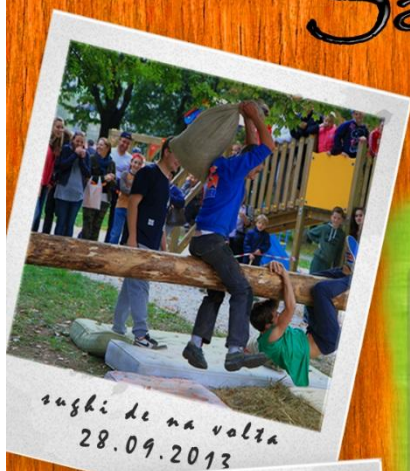
sughi de na valza 28.09.2013